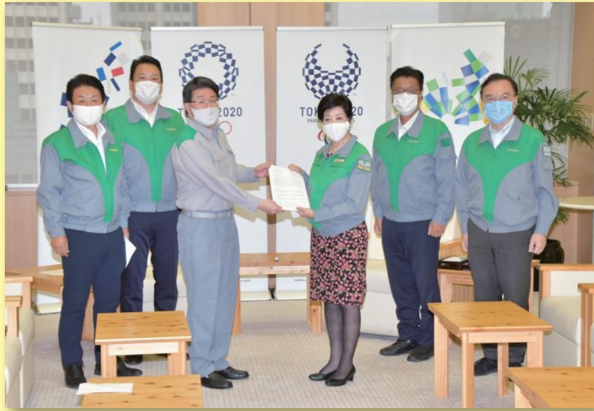
令和2年8月31日 小池知事へ申し入れ